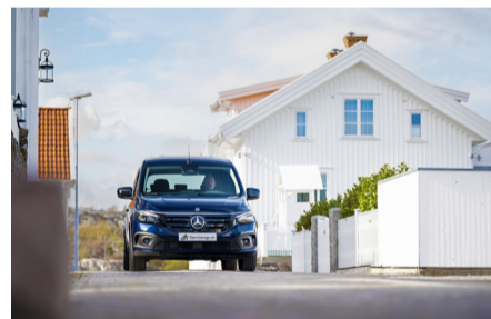
Der neue Mercedes-Benz EQT: Elektrisch, geräumig und komfortabel

Mit dem serienmässigen Infotainmentsystem MBUX (Mercedes-Benz User Experience) und dem Zugriff auf eine Vielzahl digitaler Extras von Mercedes me setzt der EQT Massstäbe bei der Konnektivität im Small Van Segment. Zu den Stärken von MBUX zählen die lernfähige Software, das intuitive Bedienkonzept über den 7-Zoll-Touchscreen oder die Touch Control Buttons am Lenkrad, die Smartphone-Integration von Apple Car Play und Android Auto, die Freisprecheinrichtung per Bluetooth-Anbindung und das Digitalradio (DAB und DAB+). Optional ist MBUX mit integriertem Navigationssystem und intelligentem Sprachassistenten «Hey Mercedes» verfügbar.