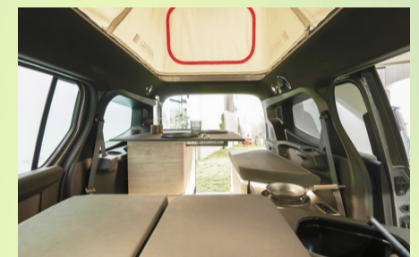
Alle Möbelteile lassen sich in 5 Minuten entfernen, so dass der EQT auch als Alltagsfahrzeug nutzbar ist.