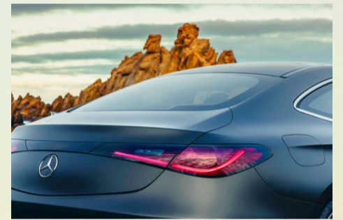
Agiles und komfortables Fahrgefühl mit dem optionalen Dynamic Body Control

Das Fahrwerk ist serienmässig um 15 Millimeter tiefer gelegt. Für ein besonders agiles und gleichzeitig komfortables Fahrgefühl sorgt das optionale DYNAMIC BODY CONTROL mit kontinuierlicher Verstelldämpfung an Vorder- und Hinterachse in Kombination mit einer Hinterachslenkung, beides gebündelt im Technik-Paket. Der Lenkwinkel beträgt bis zu 2,5 Grad. Dadurch verringert sich der Wendekreis um 50 Zentimeter. Das CLE Coupé mit Hinterradantrieb hat damit trotz seiner grösseren Abmessungen einen kleineren Wendekreis als das C-Klasse Coupé (10,7 statt 11,2 Meter).