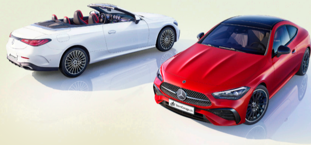
Die neuen Mercedes-Benz CLE Cabriolet und Coupé

Langer Radstand, eine weit vorne platzierte und stark geneigte A-Säule, dazu ein kurzer vorderer und ein etwas längerer hinterer Karosserieüberhang sowie stark ausgeprägte Schultern und grosse Räder – diesen sportlich-eleganten Proportionen wohnt seit jeher eine besondere Magie inne – und sie sind untrennbar mit der Marke Mercedes-Benz verbunden. Das neue CLE Coupé vereint sie mit der modernen Formsprache von Mercedes-Benz. Aus der Treue der Mercedes-Benz Designphilosophie der sinnlichen Klarheit entstand eine Skulptur voller Kraft und Dynamik, die aus jeder Perspektive ein emotionales Statement verkörpert.