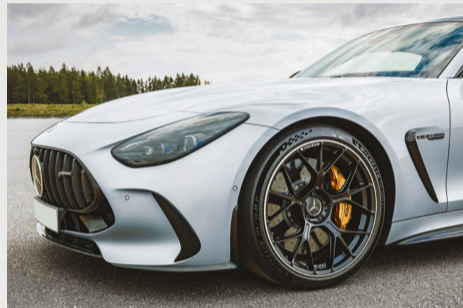
Die markanten Scheinwerfer unterstreichen den unverwechselbaren Charakter.

Die tiefe und breite AMG-spezifische Kühlerverkleidung erzeugt dominante Präsenz. Die markant ausgeprägten Scheinwerfer mit serienmässigem DIGITAL LIGHT unterstreichen den unverwechselbaren Charakter. Das Tagfahrlicht mit dem charakteristischen drei „Light-Dots“-Lichtsignet schafft einen weiteren Wiedererkennungswert.