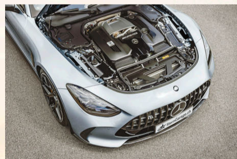
Fahrspass pur dank AMG 4,0-Liter-V8-Biturbomotor und AMG SPEEDSHIFT MCT 9G Getriebe

Das AMG SPEEDSHIFT MCT 9G Getriebe verknüpft ein emotionales Schalterlebnis mit extrem kurzen Schaltzeiten und ist speziell auf die Anforderungen im neuen AMG GT abgestimmt. Die beiden V8-Modelle sind serienmässig mit dem vollvariablen Allradantrieb AMG Performance 4MATIC+ ausgestattet. Der Fahrer kann sich auch auf hohe Fahrstabilität und Fahrsicherheit unter allen Bedingungen verlassen: bei trockener Fahrbahn genauso wie bei Nässe oder auf Schnee.