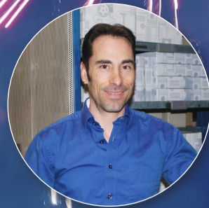
Beda Steiner Teilelogistik PW – 5 Jahre

«Der Kontakt zu unseren Kunden bereitet mir grosse Freude. Ihnen einen köstlichen Kaffee oder ein erfrischendes Getränk anzubieten und sie dann zu unserem Kundendienst oder den Verkaufsberatern weiterzuleiten. In meiner täglichen Arbeit wird es nie langweilig.»