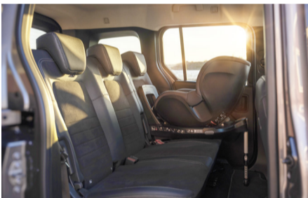
Auf der Rückbank finden bis zu drei Kindersitze Platz.

Dank der geschützten, schwerpunktünstigen und platzsparenden Installation der Batterie im Unterboden bietet der neue EQT die nahezu gleiche Variabilität und Funktionalität im Innenraum wie die konventionell angetriebene T-Klasse. Der EQT ist 4'498 Millimeter lang, 1'859 Millimeter breit und 1'819 Millimeter hoch. Eine Variante mit langem Radstand folgt. Ebenso wie die T-Klasse bietet der neue EQT viele Vorteile, die den Alltag für Familien und Freizeitaktive einfach und komfortabel machen. Dazu zählt etwa die niedrige Ladekante von nur 561 Millimetern, die das Beladen mit schweren Gegenständen erleichtert. Die Schiebetüren auf beiden Fahrzeugseiten bieten eine Öffnung von je 614 Millimetern Breite und 1'059 Millimetern Höhe. So ermöglichen sie einen komfortablen Zugang zum Fond, und das Beladen kann inklusive Heckklappe flexibel von drei Seiten erfolgen.