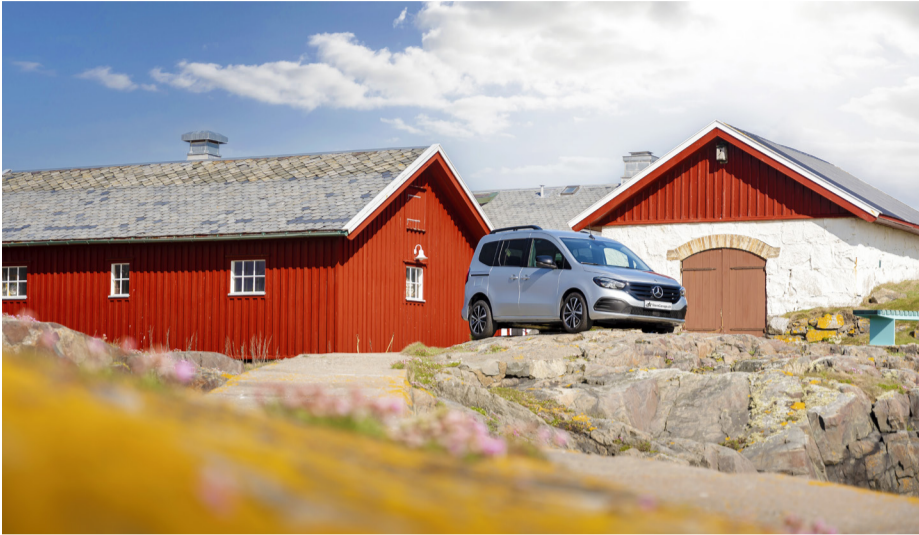
Der EQT ist der perfekte Begleiter für Familien und Freizeitaktive.

Der neue EQT von Mercedes-EQ bietet Familien sowie freizeitaktiven Menschen einen attraktiven Einstieg in die vollelektrische Welt der Marke mit dem Stern. Der elektrische Small Van kombiniert kompakte Aussenmasse mit grossem Raumangebot.