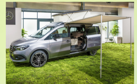
Der neue kleine Van von Mercedes EQ mit Marco Polo Modul für grossen Camping-Komfort