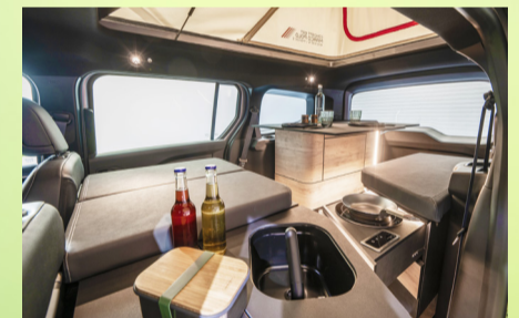
EQT + Marco Polo Ausstattung = neuer Micro-Camper