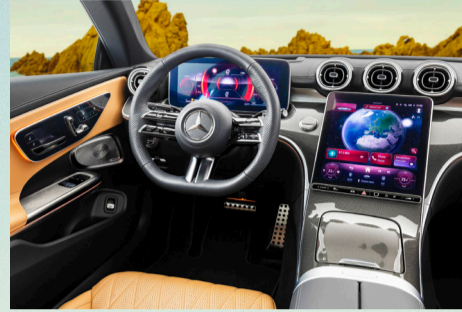
Ein Blickfang sind die digitalen Displays.

Blickfang im Interieur sind das freistehende 12,3-Zoll grosse voll-digitale Instrumentendisplay, das 11,9-Zoll grosse, fahrerorientierte Zentraldisplay im benutzerfreundlichen Hochformat und die dynamische Ambientebeleuchtung mit 64 Farben. Sie zieht sich auf Wunsch schwingvoll von der Mittelkonsole bis unter die äusseren Lüftungsdüsen. In den Türen verläuft je ein Lichtband entlang der Formlinien der Armauflage und der Bordkante bis in den Fondbereich. Ein weiteres Highlight sind exklusiv für den CLE entwickelte Frontsitze im Integralsportdesign. In Verbindung mit dem optionalen Burmester® 3D Surround-Soundsystem verfügen sie über jeweils zwei Lautsprecher auf Höhe der Kopfstützen. Damit erzeugen sie direkt in Ohrnähe ein besonders individuelles und immersives Musikerlebnis mit Dolby Atmos und Spatial Audio.