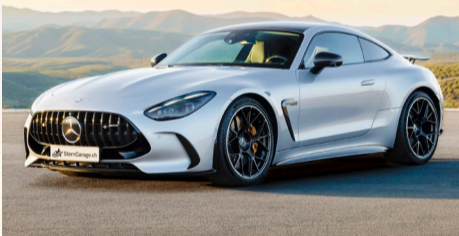
Ein Sportwagen ohne Kompromisse

Die zweite Generation des Mercedes-AMG GT Coupés ist das neue Spitzenmodell im Mercedes-AMG Angebot. Es kombiniert hochdynamische Fahreigenschaften mit gesteigerter Alltagstauglichkeit. Hightech-Komponenten wie das AMG ACTIVE RIDE CONTROL Fahrwerk mit aktiver Wankstabilisierung, die serienmässige Hinterachslenkung und die aktive Aerodynamik schärfen das fahrtaktive Profil. Das sportliche Coupé bringt darüber hinaus seine Leistung erstmals mit dem vollvariablen Allradantrieb AMG Performance 4MATIC+ auf die Strasse. Im Zusammenspiel mit dem AMG 4,0-Liter-V8-Biturbomotor ergibt dies ein Fahrerlebnis auf höchstem Niveau. Die exklusive AMG Sportwagen-Architektur mit der aufwändigen Verbundaluminium-Karosseriestruktur ermöglicht die Auslegung als 2+2 Sitzer. Das bedeutet für einen Sportwagen dieser Klasse ein sehr gutes Raumgefühl für Reisende und viel Platz für deren Gepäck. Das neue Mercedes-AMG GT Coupé stellt als fünfte eigenständige Baureihe nach SLS, der ersten Generation des zweitürigen GT, GT 4-Türer Coupé und SL die hohe technologische Kompetenz des Affalterbacher Entwicklungsteams ein weiteres Mal unter Beweis.