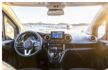
EQT Cockpit mit zahlreichen Assistenzsystemen

Ob in der Gebäudetechnik, beim Wäschetrockner oder in Umkehrfunktion im Kühlschrank: Wärmepumpen ermöglichen eine besonders energiesparende Klimatisierung. Auch der EQT nutzt eine Wärmepumpe, um besonders energieeffizient zu sein, den Strombedarf zu reduzieren und durch ein aktives Thermomanagement den Grossteil der Energie für eine stabile Reichweite des Fahrzeugs bereit zu stellen. Die Batterie des Fahrzeugs versorgt lediglich den Kompressor der verbauten Wärmepumpe und übernimmt nicht die eigentliche Klimatisierung des Fahrzeuginnenraums.