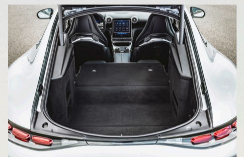
Alltagstauglich mit 2+2 Sitzen und grossem Gepäckraum

Ausserdem ist der neue AMG GT serienmässig mit einer aktiven Hinterachslenkung (HAL) ausgestattet. Abhängig von der Geschwindigkeit lenken die Hinterräder entweder in die entgegengesetzte (bis 100 km/h) oder in die gleiche (schneller als 100 km/h) Richtung wie die Vorderräder. Das System ermöglicht damit gleichermaßen ein agiles und stabiles Fahrverhalten – Eigenschaften, die ohne Hinterachslenkung im Gegensatz zueinanderstehen.