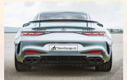
Die grosse Heckklappe mit aktivem, ausfahrbarem Spoiler.

Mithilfe von zahlreichen Sensoren, Kameras und Radar beobachten die Fahrerassistenzsysteme den Verkehr und das Umfeld des neuen Coupés. Wenn nötig, können die intelligenten Helfer blitzschnell eingreifen. Fahrerinnen und Fahrer werden durch zahlreiche neue oder erweiterte Systeme unterstützt – in Alltagssituationen zum Beispiel durch Abstandsregelung, Lenken und Spurwechsel. Bei Gefahr helfen die Systeme, situationsgerecht auf eine drohende Kollision zu reagieren. Die Funktionsweise der Systeme wird durch ein neues Anzeigekonzept im Kombiinstrument visualisiert.