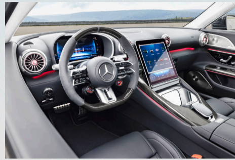
Luxuriöses Interieur mit hochwertigen Materialien und modernster Technologie

Das Interieurdesign des neuen AMG GT bedient sich der High-Performance Sportwagen-Gene von AMG, die gekonnt in eine digitale Welt übersetzt und konsequent weiterentwickelt wurden. Materialien, Verarbeitung und «Attention-To-Detail» unterstreichen den Luxusanspruch des Fahrzeugs im Interieur. Die Cockpit-Gestaltung bis hin zum Zentralsdisplay in der Mittelkonsole ist auf den Fahrer fokussiert und überzeugt mit einem harmonischen Gesamteindruck. Das voll-digitale Kombiinstrument ist in ein dreidimensionales Visier integriert.